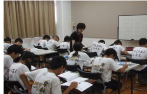
チューター学習会