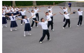
伝統の魂のエール