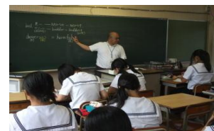
習熟度別少人数授業