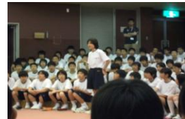
全体ミーティング